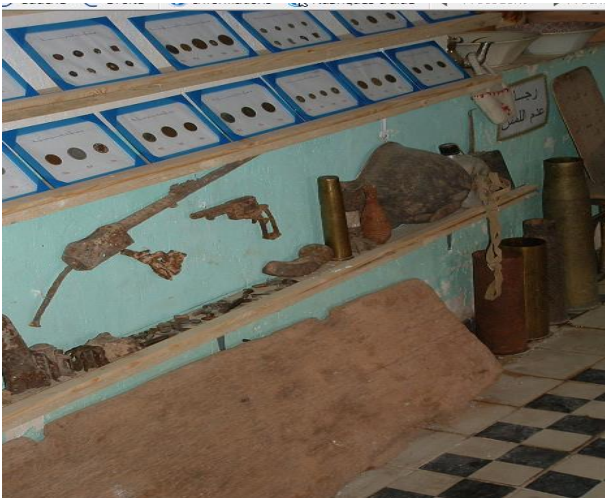
معرض أدوات قديمة