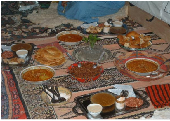
مأكولات شعبية تقليدية