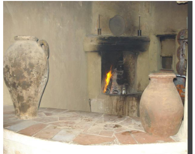
منزل بقصر قديم