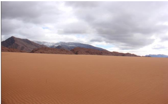
كثبان رملية بريزينة